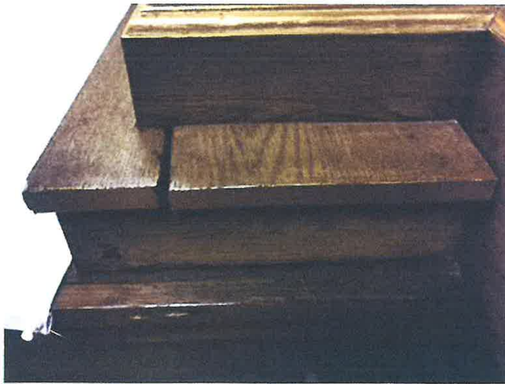
Zniszczenia struktury ołtarza.