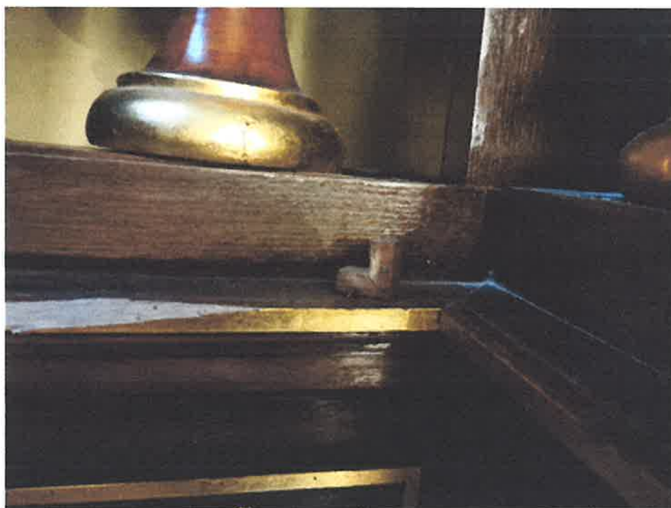
Zniszczenia struktury ołtarza.