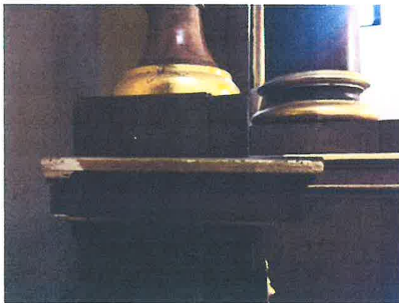
Zniszczenia struktury ołtarza.