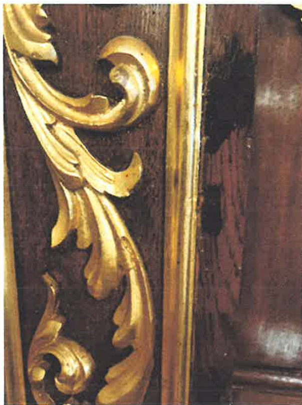
Odbarwienia struktury architektonicznej