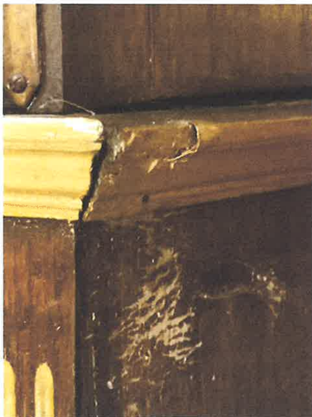
Zniszczenie struktury architektonicznej