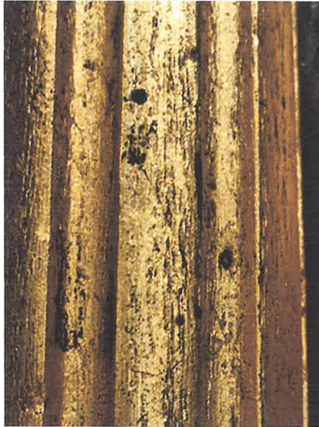
Zniszczenie dekoracji pozłotniczych