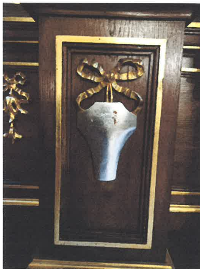
Zniszczenia struktury ołtarza.