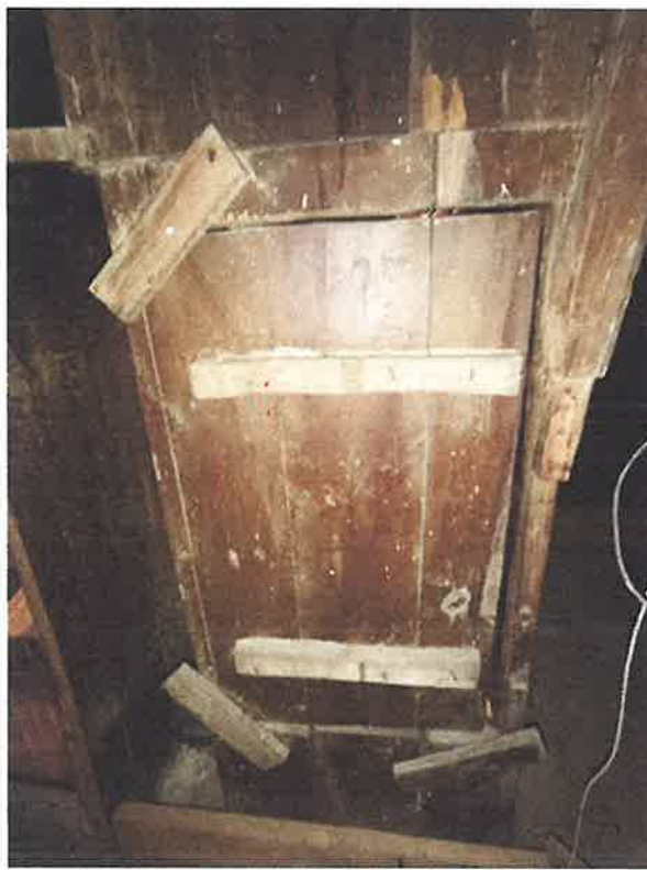
Zniszczenie struktury architektonicznej