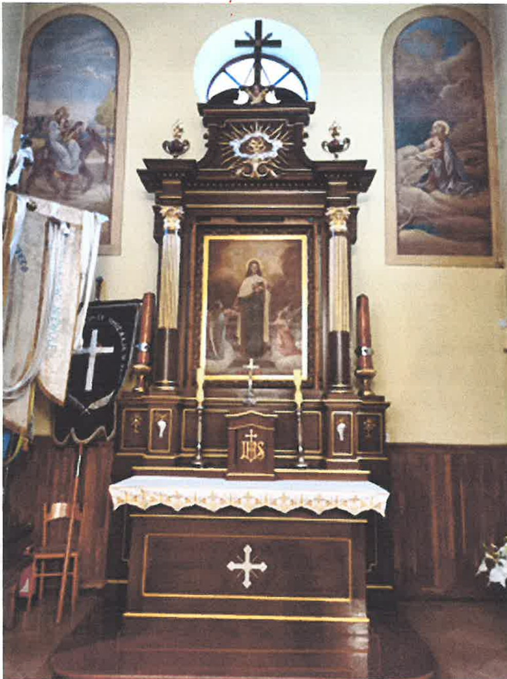
OLTARZ BOCZNY LEWY

Pawel Sadle Konservator Dziel Sztuk artysta plastyki Pawel Sadle zaśw. 57 z 14.07.23