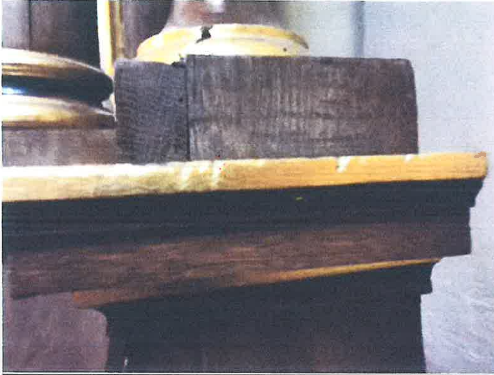
Zniszczenia struktury ołtarza.