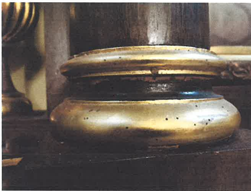
Zniszczenia struktury ołtarza.