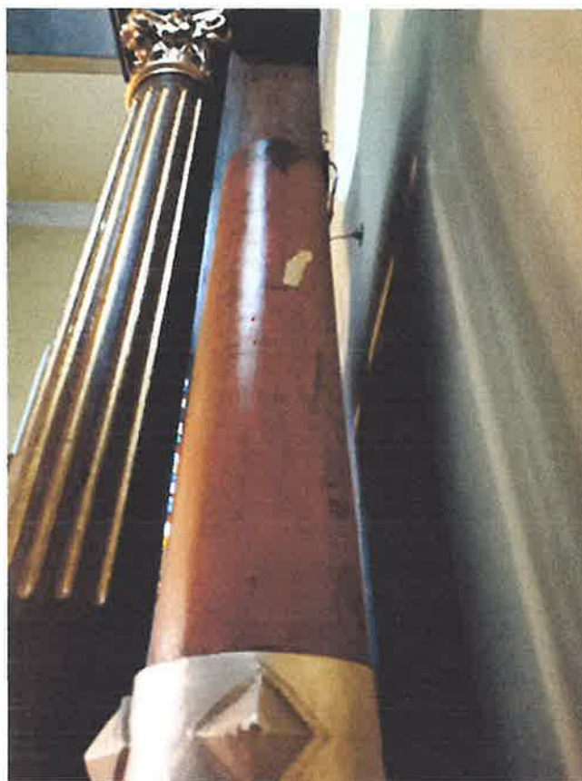
Zniszczenia struktury ołtarza .