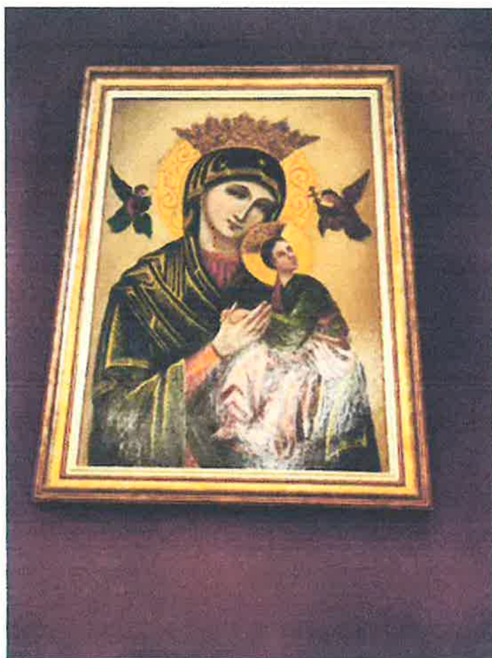
Obraz z pola środkowego.