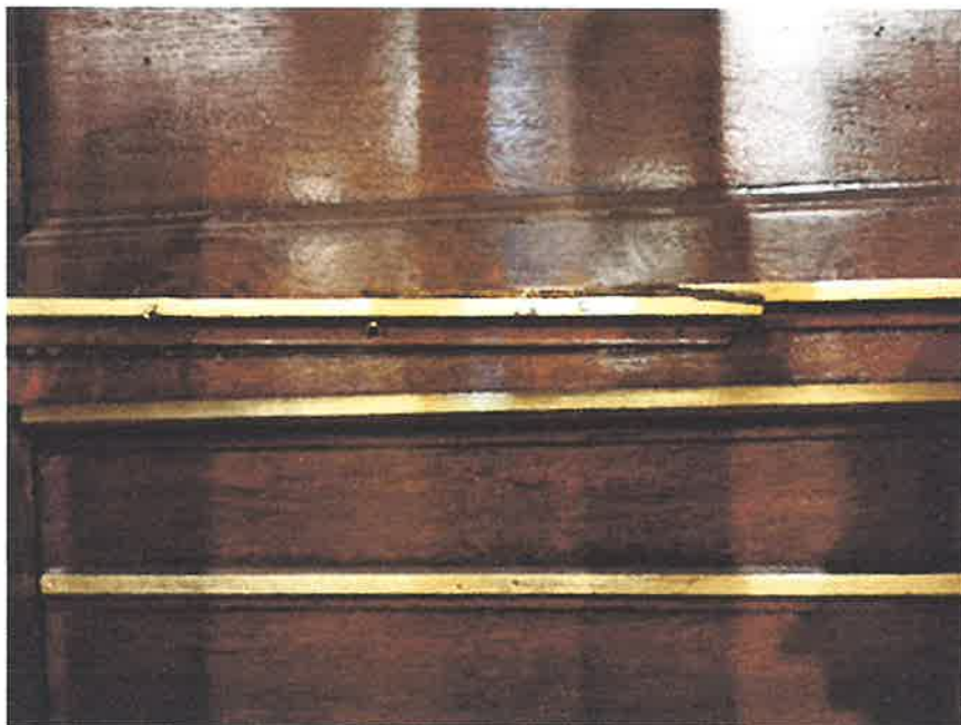
Zniszczenie struktury architektonicznej i dekoracji pozłotniczych